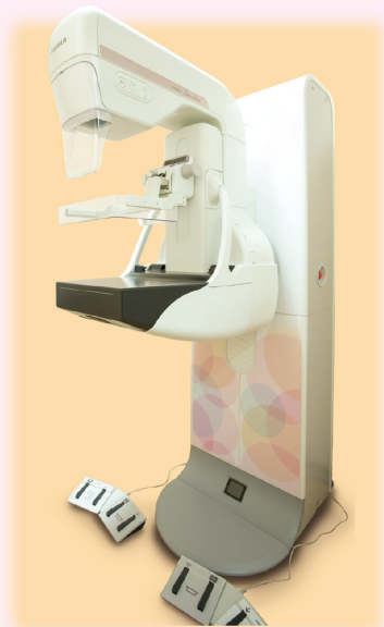
富士フィルムメディカル社製 AMULET Innovality

杉並健診プラザでは 最新の3Dマンモグラフィ装置(トモシンセシス)を導入いたしました。