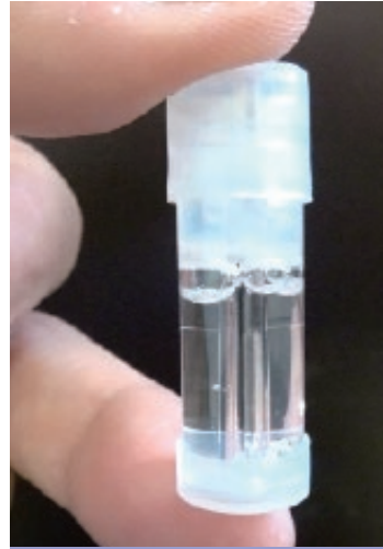
ネバネバの有機溶剤 グリセロール(独:グリセリン)