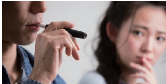
近くで加熱式を使用された場合、タバコを吸わない人の半数に気分不良などの健康被害が生じる

*Tabuchi T, et al. Heat-not-burn tobacco product use in Japan. Tobacco Control. 2018;27:e25-e33