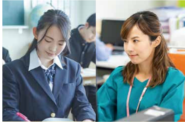
女性のライフステージと健康課題

痛み止めが欠かせない・生活に支障が出るくらいの痛みがある人は婦人科へ。原因となっている疾患を治療するとともに、鎮痛薬、漢方薬、子宮収縮抑制薬、低用量ピルなどを使うことで、毎月の痛みをぐっと楽にすることができます。