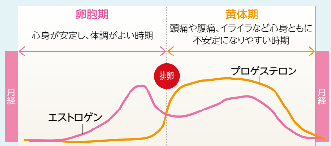
■月経周期と女性ホルモン

女性ホルモンは右図のように周期的に変化し、エストロゲンが多い卵胞期は心身の状態が安定しますが、プロゲステロンが多い黄体期は不安定になりがちです。とくに月経前の心身の不調(イライラ、落ち込み、乳房や下腹部の張りなど)を月経前症候群(PMS)といい、多くの女性が経験しています。 女性は毎月の月経周期においても変化の波にさらされている といえます。PMSの症状は漢方薬、精神安定剤、低用量ピルなどで軽減できますので、悩んでいる人は婦人科へ。