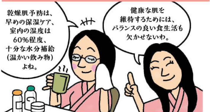
なぞなぞ原案:こんのゆみ(T&Yなぞなぞ)